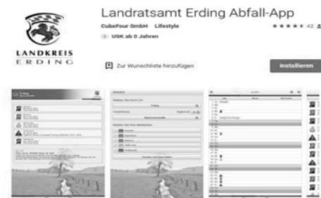
Die neue Abfall-App des Landratsamtes Erding. Bleiben Sie immer informiert - über Abfuhrtermine, Annahmestellen, Problemmüll und vieles mehr.

Die neue Abfall-App des Landkreises Erding können Sie unkompliziert auf Ihr Handy laden und erhalten damit immer rechtzeitig eine Erinnerung wann welcher Müll abgeholt wird.